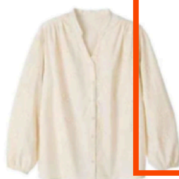
Blouse. 59,99 €, Damart.

Quand l'allure bohème rencontre le look minimaliste, ça donne le style « fille du désert », élégant et hyper facile à adopter !