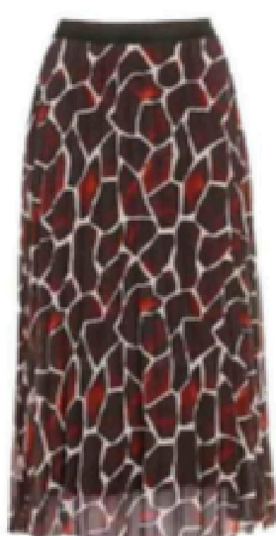
Jupe. 185 €, La Fée Maraboutée.