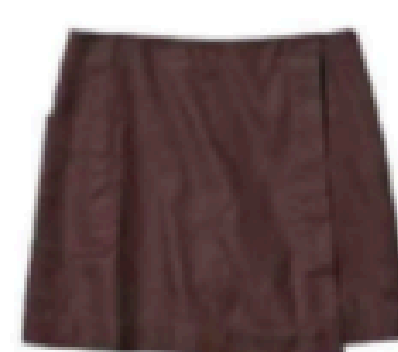
Jupe-short. 29,90 €, Uniqlo.