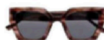
Lunettes de soleil. 69 €, Charlie Chill chez Optic 2000.