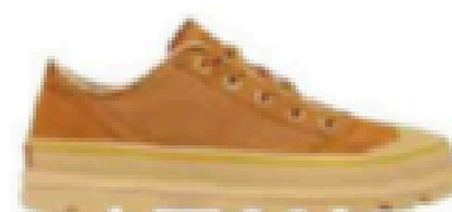
Baskets. 120 €, Sorel.