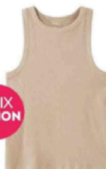
Débardeur. 6 €, Kiabi.