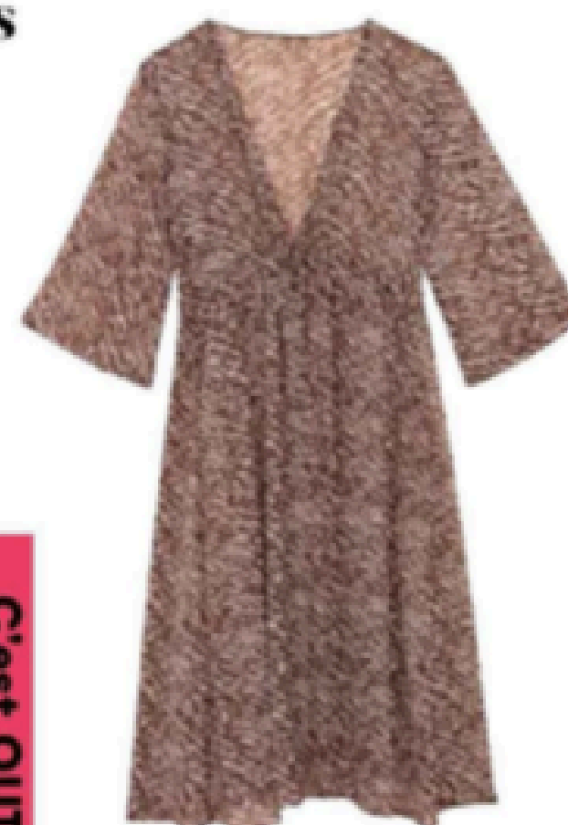
Robe. 11,95 €, Tissaia de E. Leclerc.