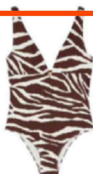
Maillot de bain. 16 €, Primark.