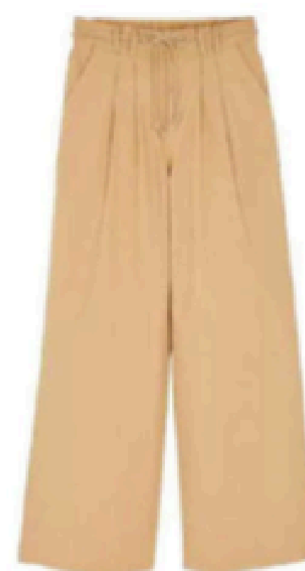
Pantalon. 29,90 €, U Collection.

On fait la part belle aux couleurs chaudes et aux coupes amples et confortables