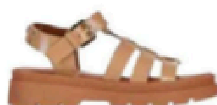
Sandales. 99 €, JB Martin.