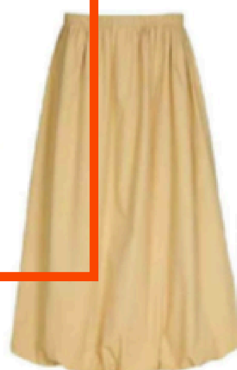
Jupe. 29,99 €, C&A.