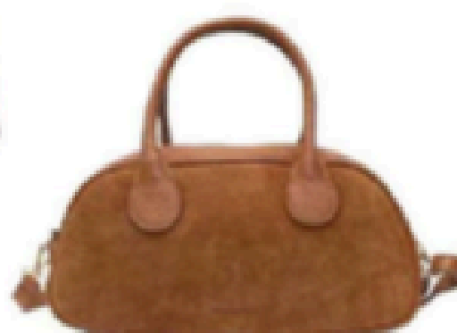
Sac à main. 105 €, Cherry Paris.