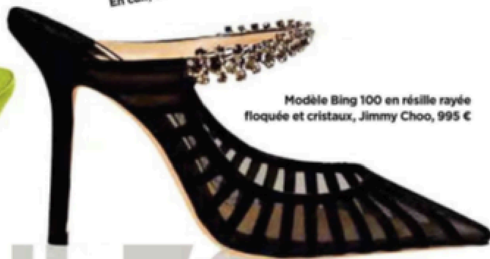
Modèle Bing 100 en résille rayée floquée et cristaux, Jimmy Choo, 995 €