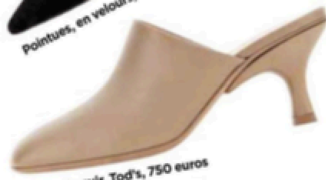
En cuir, Tod's, 750 euros