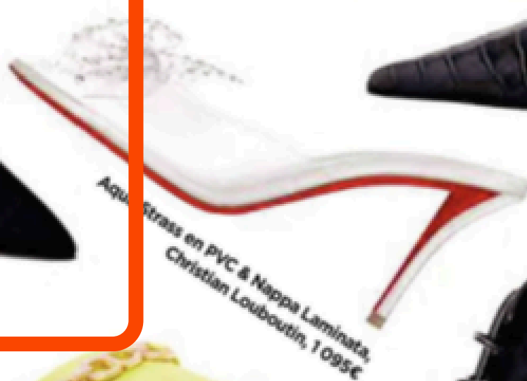
Aquatrass en PVC & Nappa Laminata, Christian Louboutin, 1095€