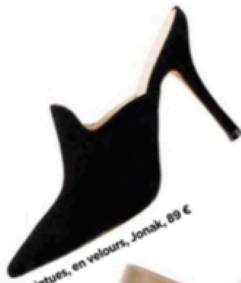
Pointues, en veilsours, Jonak, 89 €