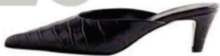
Fermées, Toteme sur Matches, 559 €