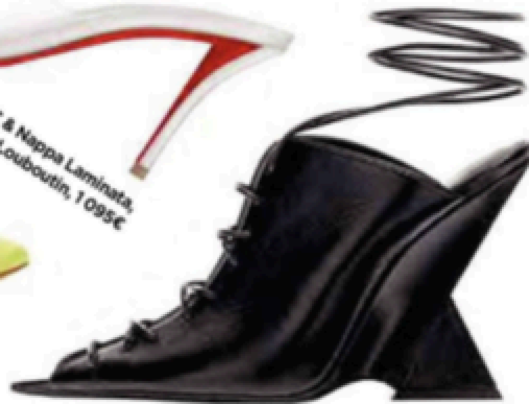
Lacée, The Attico, 840 €