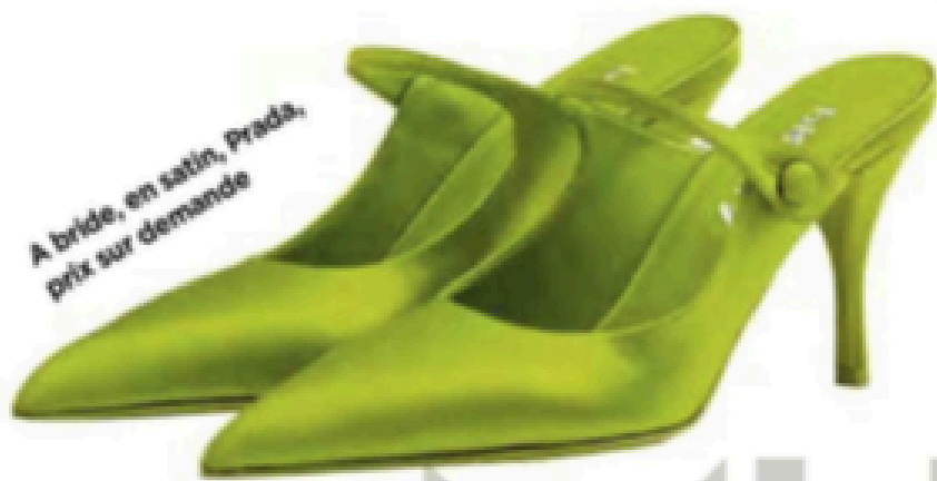
A bride, en satin, Prada, prix sur demande