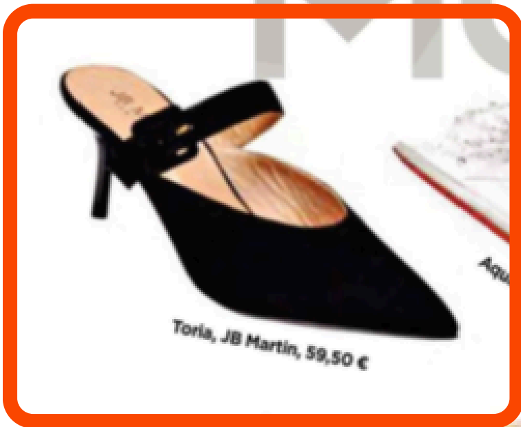
Toria, JB Martin, 59,50 €