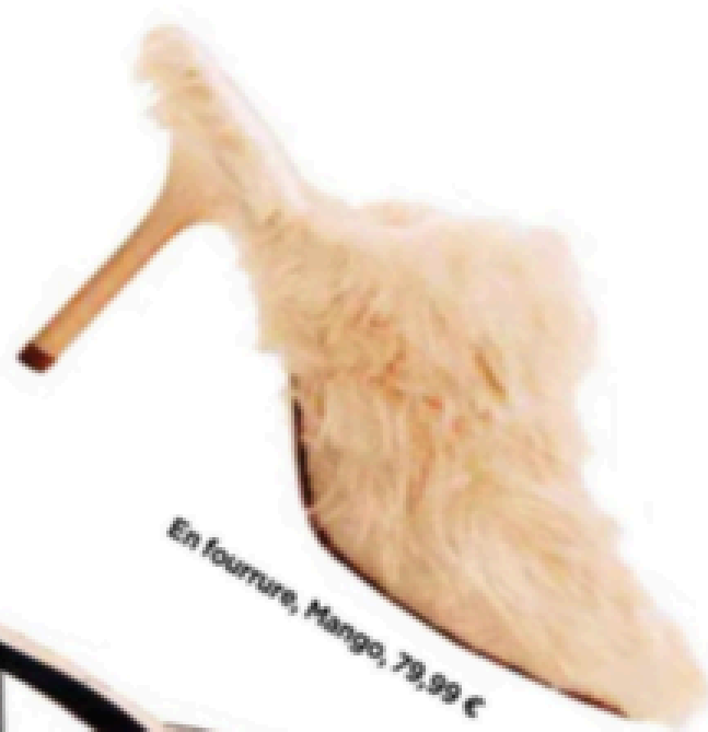
En fourrure, Mango, 79,99 €